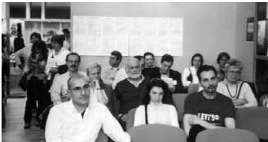
Torino, Salone del Libro, lo stand della Sardegna durante la presentazione