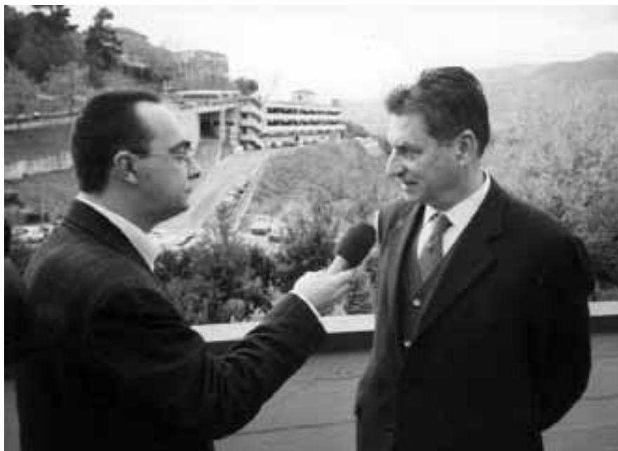
Penne, intervista a Claudio Magris

Negli interventi successivi, l'ungherese