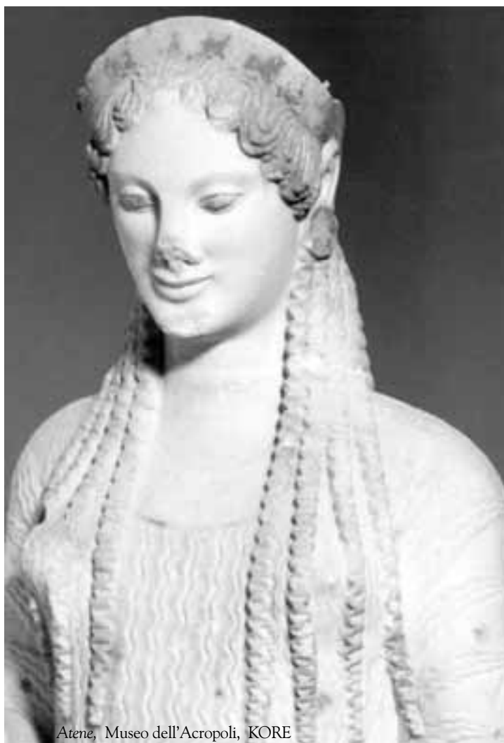
Atene, Museo dell'Acropoli, KORE